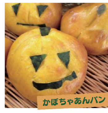
かぼちゃあんパン