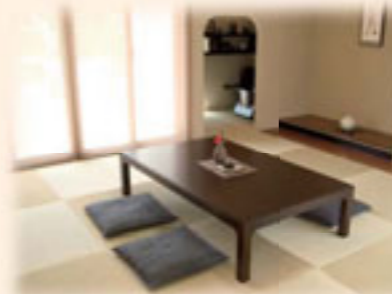
■写真はイメージです

以前から、省エネのガス給湯機を使うなど興味はあったのですが、あまり深く考えてはいませんでした。