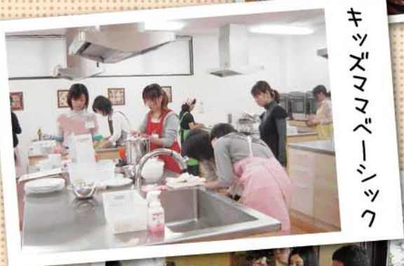
キッズママベーシック