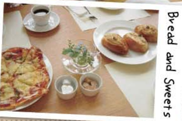
Bread and Sweets