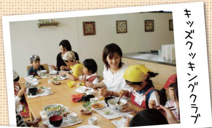
キッズクッキングクラブ