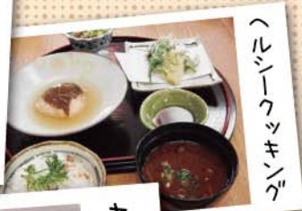
ヘルシークッキング