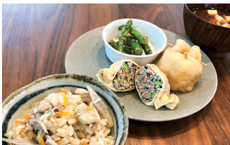
タッチアンドトライ