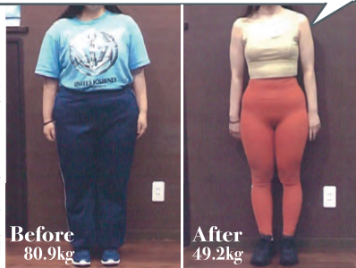
※利用者実績には個人差があります

トレーニングで筋肉を増やしながら運動習慣に理想の体重に。リバウンド指導も行う「基礎体温が上がって妊娠できた」という嬉しい報告もあったという。